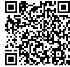
LINE公式アカウント QRコード