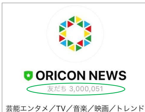
LINE公式アカウント画像 ※4月21日時点