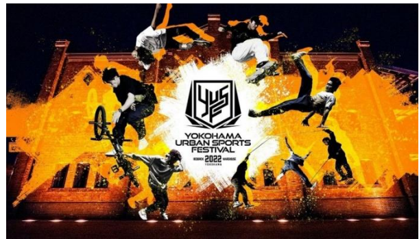
「YOKOHAMA URBAN SPORTS FESTIVAL 2022」 https://yusf.jp/