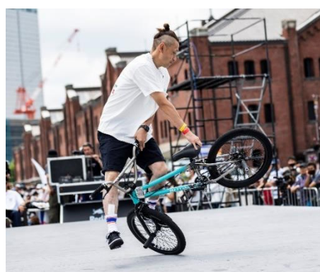
BMX FLATLAND