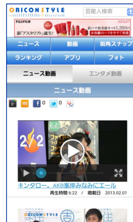
スマホ向けニュース動画サイト